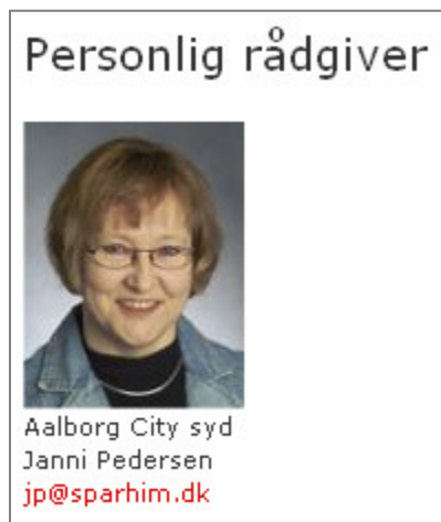
Figur 4 - persRaadgiver, som den kan se ud på sitet.

Når parametrene er udfyldte og folderlayoutet er publiceret kunne komponenten komme til at se ud som i figur 4 herunder.