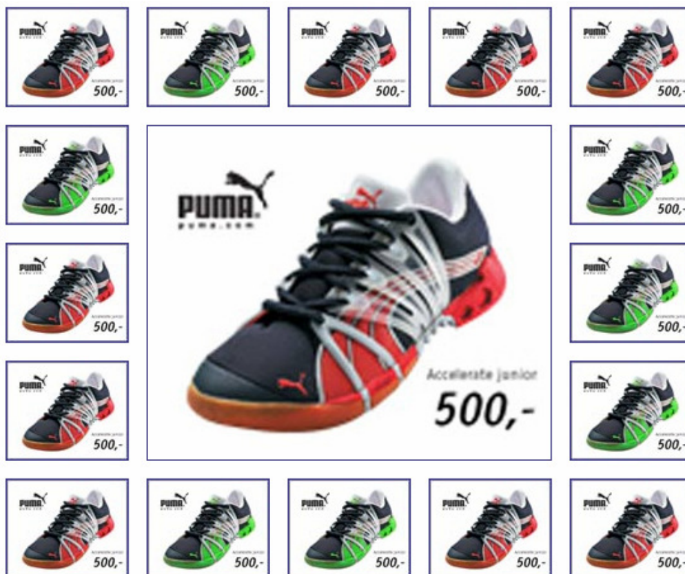
Figur 1 - Billedgalleri som det kan se ud på sitet.

Med dette modul er det muligt at opsætte et billedgalleri, som viser en specifik CMD-mappes billeder som små thumpnails. Klikker brugeren på de små thumpnails, bliver billede vist i stor format. Et eksempel kan ses på figur 1 herunder.